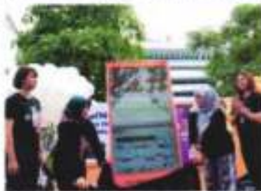
Tim kampanye KPU Kota Semarang menggelar kampanye di rumah-rumah warga di kawasan Bundaran HI Semarang, Sabtu (12/12/2020).