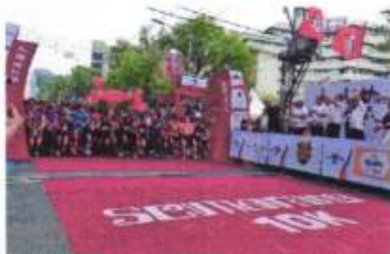
START SEMARANG 2020 (1) Peserta lomba lari maraton di kawasan Bundaran HI Semarang, Sabtu (12/12/2020). (2) Peserta lomba lari maraton di kawasan Bundaran HI Semarang, Sabtu (12/12/2020).