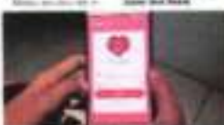
Salah satu pengguna aplikasi kesehatan di Kota Semarang, Sabtu (12/12/2020).