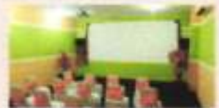
D. Ruang perputakaan