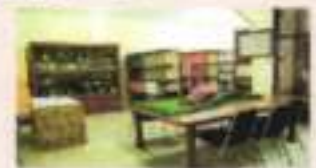
E. Ruang PPIID