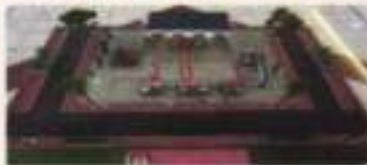
HALAT TERPADU PERUNGUTAN SUARA (TPS)

A. Ruang simulasi, yaitu ruangan yang menandakan sistem perungutan suara di TPS melalui rekam atau tiruan. Pada ruangan ini terdapat Model TPS dan Simulasi Perungutan Suara.