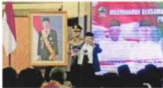
Wapres Ingatkan 4 Hal dalam Kembangkan Ekonomi Syariah